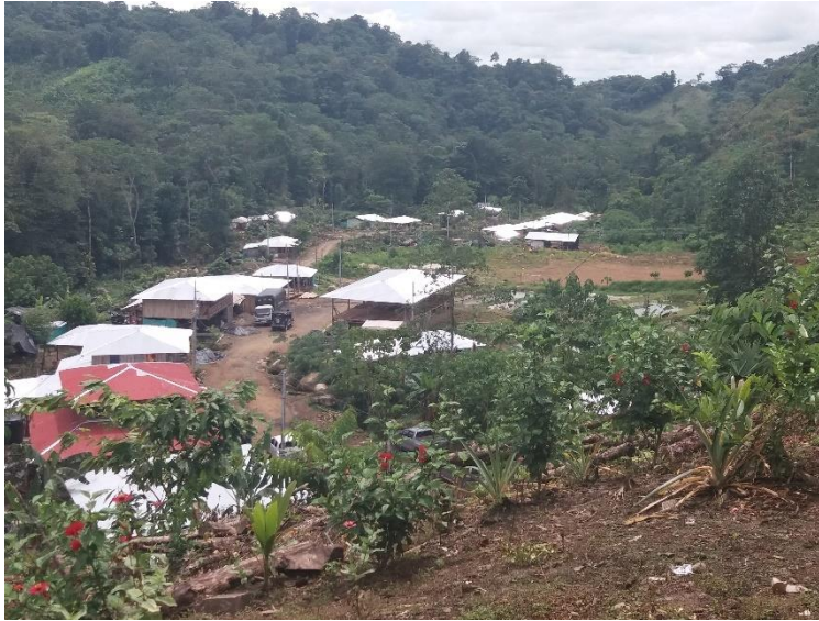
Entisten sissitaistelijoiden uusi asuinalue San José de Leonin kylässä Mutatassa, kuva Arja Koskinen